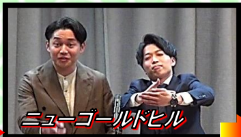
ニューゴールドヒル

下の「クリスタル大坪」の画像 を使って、写真で一言。 スべると、スタートに戻る。