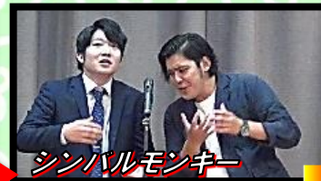
シンバルモンキー

大喜利「こんな学校は嫌だ。」 右隣のプレイヤーとマスを ウケれば、1マス進める。 スべると、1マス戻る。