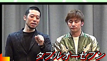
ダブルオーセブン