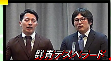
群青デスペラード

「創作ウソ昔話」を披露。 完成度が高ければ、2マス進む。 完成度が低ければ、2マス戻る。