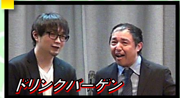
ドリンクパーゲン