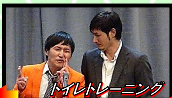
トイレトレーニング