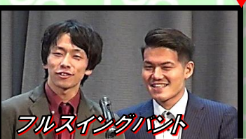
フルスイングハント